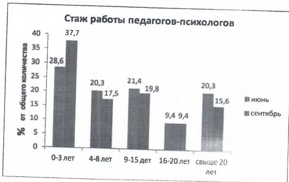
Рисунок 1. «Стаж работы педагогов-психологов»

В соответствии с полученными данными, наибольшая доля, как и в июне, – это стажевая группа от 0 до 3 лет. При этом отмечается увеличение показателей в данной группе к сентябрю, что говорит о достаточно большом количестве молодых специалистов среди работающих в ОУ педагогов-психологов. Также отмечается уменьшение показателей в стажевой группе свыше 20 лет. В остальных стажевых группах показатели изменились незначительно.